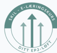
DITT EPJ-LØFT INFODOC