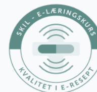
KVALITET I E-RESEPT